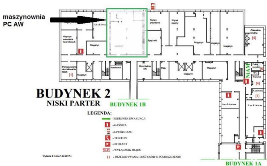
Fot. Lokalizacja pomp ciepła