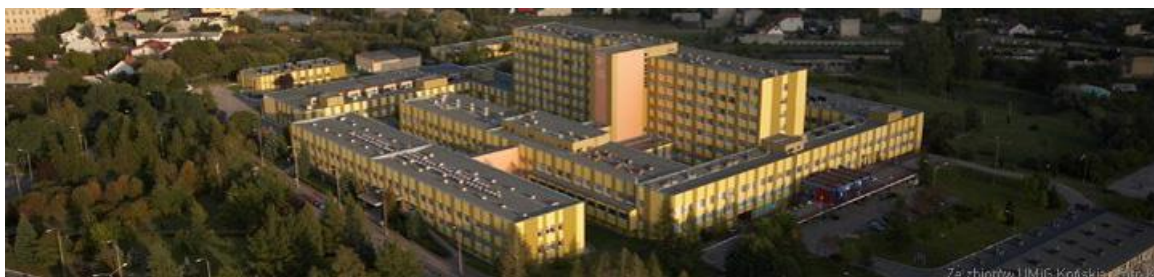
Zdjęcie 1 Szpital św. Łukasza w Końskich